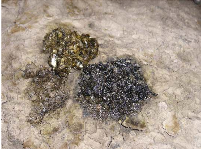
Figure 3 : Épreintes de loutres.

Les épreintes (nom particulier donné aux crottes de loutres) se présentent sous forme de petits tas (souvent allongés, parfois légèrement cylindriques) verdâtres, noirs ou gris, selon l'état de fraîcheur (fig. 3). Elles contiennent généralement des écailles et des ossements de poissons. Leur odeur très particulière est certainement le meilleur critère pour les identifier. En effet, contrairement à la plupart des crottes, elles ne sentent pas « mauvais », mais sentent curieusement le miel (de châtaignier pour être précis) mêlé à un léger fumet de poisson. Les épreintes sont déposées sur les rives des cours d'eau, souvent sur une pierre, au pied d'un arbre, au niveau d'une confluence ou d'un pont, en quelque sorte au niveau de tout élément se distinguant du reste du paysage.